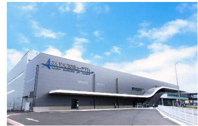
[あいち航空ミュージアム外観]