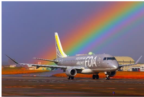
最優秀賞「虹の源」