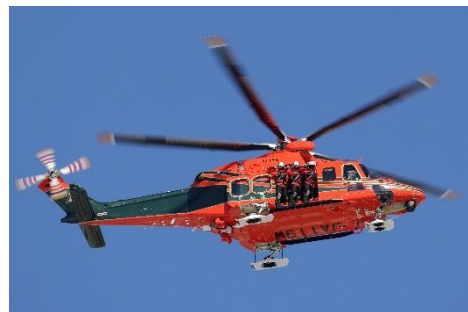
部門優秀賞(D)「答礼航過」