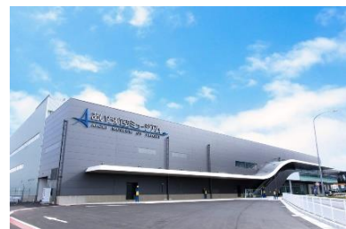
[あいち航空ミュージアム外観]