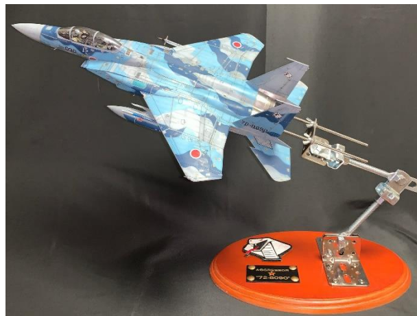
第2回プラモデルコンテスト最優秀賞 「AGGRESSOR”72-8090”」