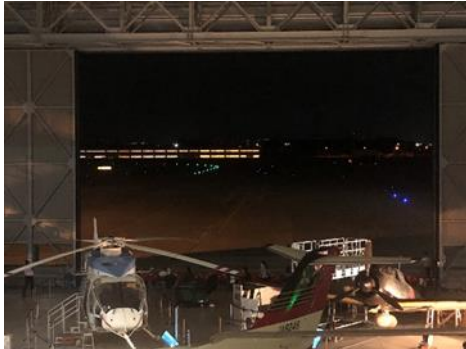
[大扉一部開放の様子]