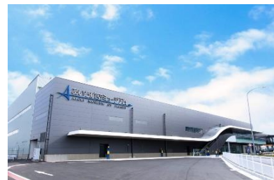
[あいち航空ミュージアム外観]