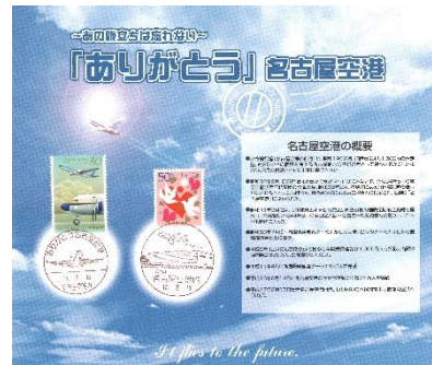
名古屋空港内郵便局「閉局」記念 台紙付・写真付切手