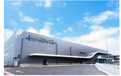
[あいち航空ミュージアム外観]