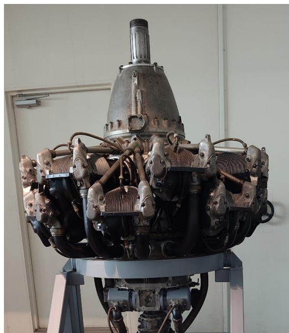
【火星二一型エンジン】

一式陸上攻撃機や二式大型飛行艇などに搭載された高出力のエンジン。三菱重工業株式会社において開発され、1938(昭和13)年から1945(昭和20)年の間に15,901台が製造されました。