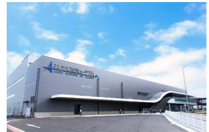
[あいち航空ミュージアム外観]