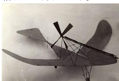
【鳥型飛行器】

二宮忠八が創建した「飛行神社(京都府八幡市)」所蔵の「鳥(カラス)型飛行器」・「玉虫型飛行器」の模型(模造品)及び、飛行原理発見に関しての資料等を特別にお借りして展示します。