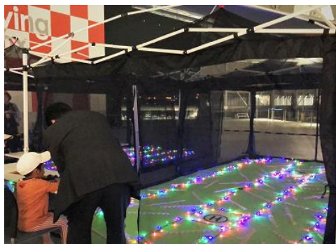
[ドローン体験 夜バージョンの様子]