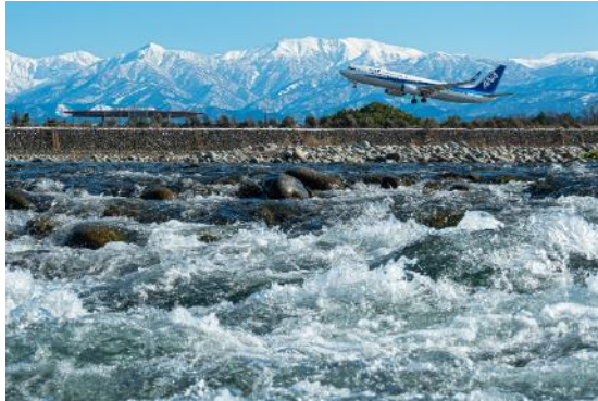
最優秀賞「雪解けの地を蹴って Arrival」