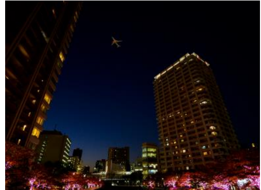
民間機部門グランプリ賞「冬の桜」