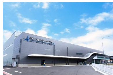
[あいち航空ミュージアム外観]