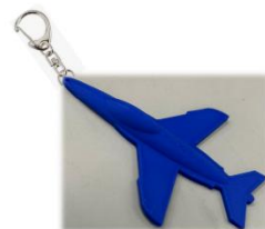
【キーホルダー(青色)】

広陽商工株式会社から講師をお招きし、3Dプリンタを使用してのモデリング教室を開催します。3Dモデリングツールを使用して、ブルーインパルス・オリジナルキーホルダーを作ります。