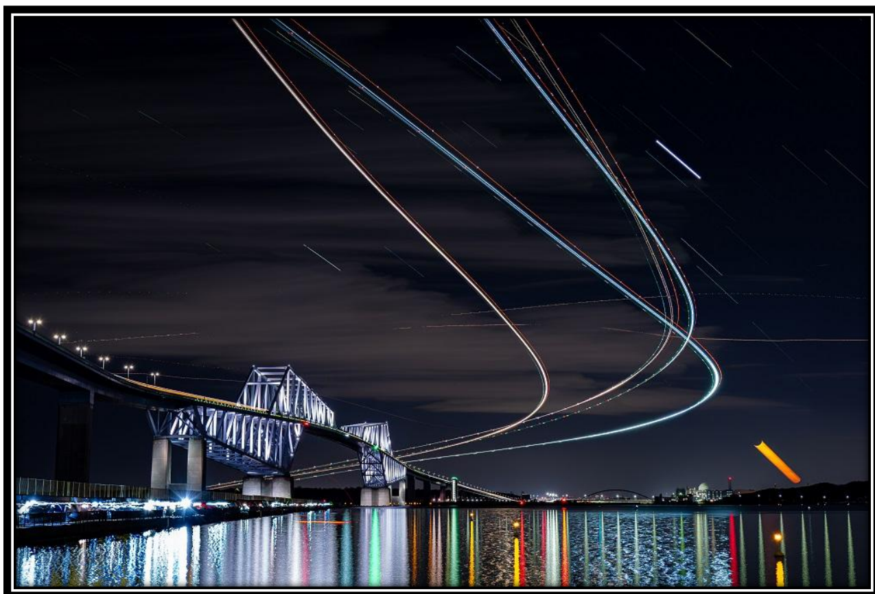
第7回フォトコンテスト民間機部門グランプリ賞「夜空のキャンパス」