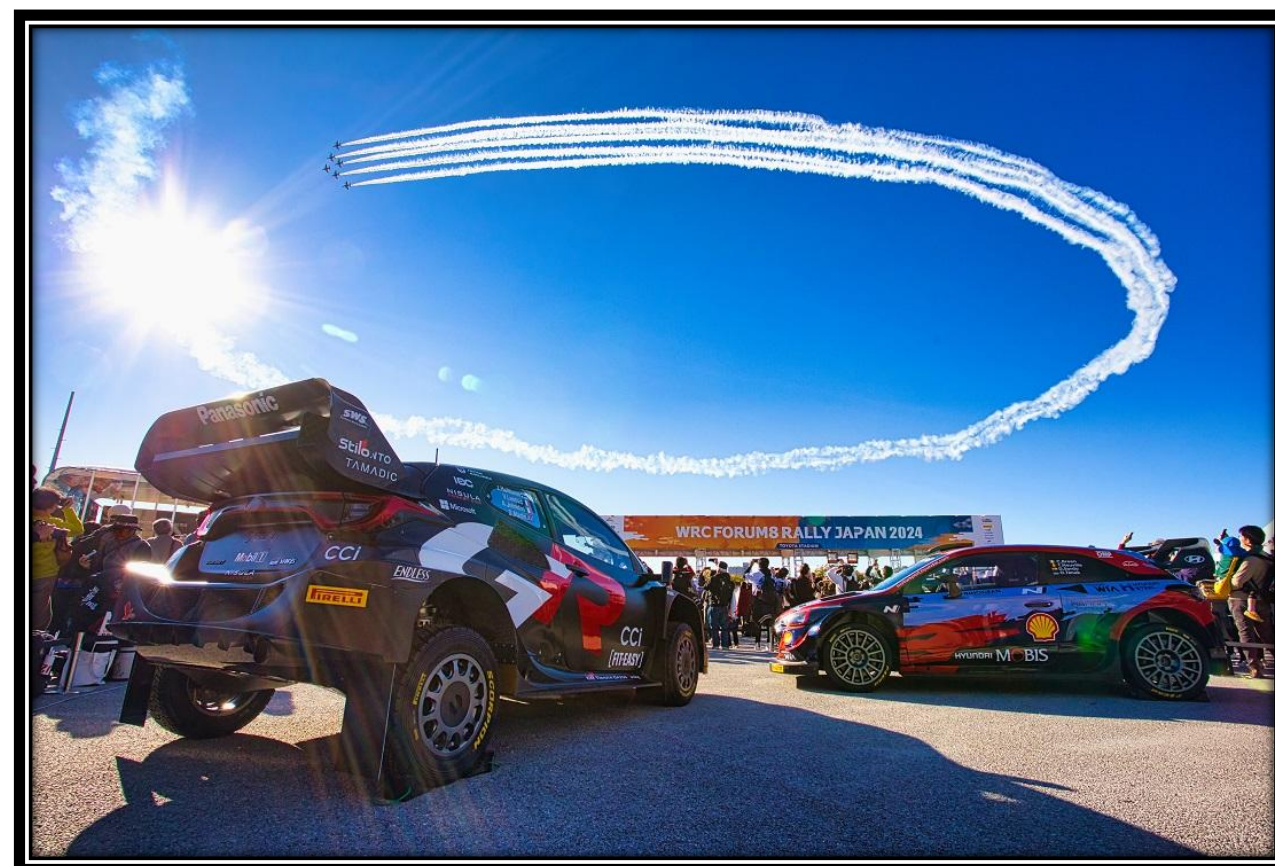
第7回フォトコンテスト官用機部門準グランプリ賞「ブルーインパルスに世界が歓声」