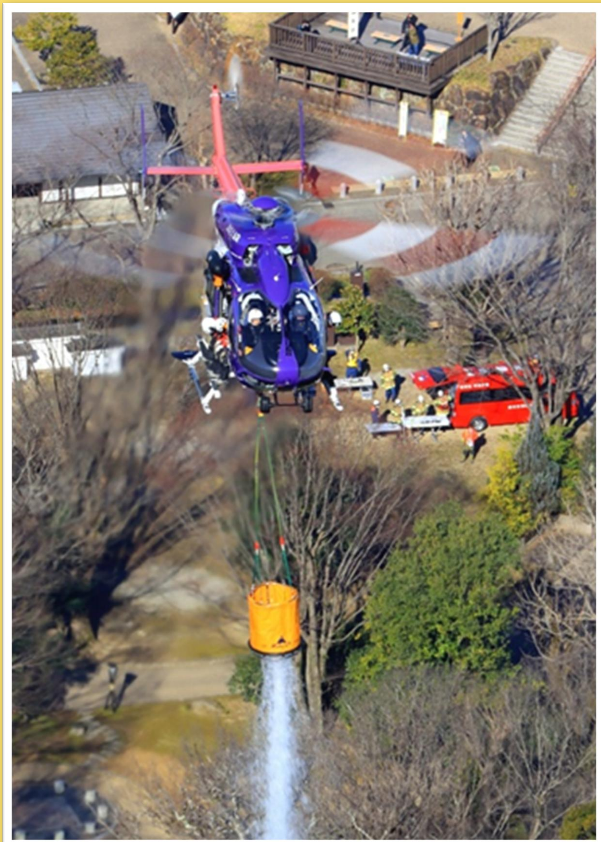
第7回フォトコンテスト官用機部門グランプリ賞「林野火災消火訓練」

(自衛隊の航空機及び警察・消防・防災・ドクヘリ等の公用の航空機並びに他国の官用機)