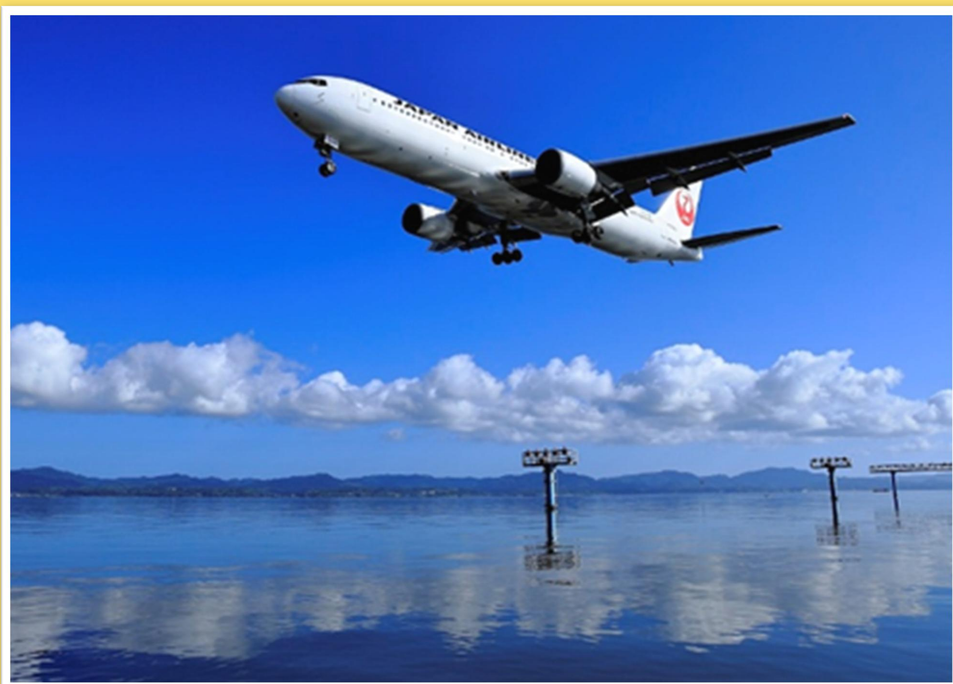
第7回フォトコンテスト最優秀賞「晩夏の朝、湖畔にて」