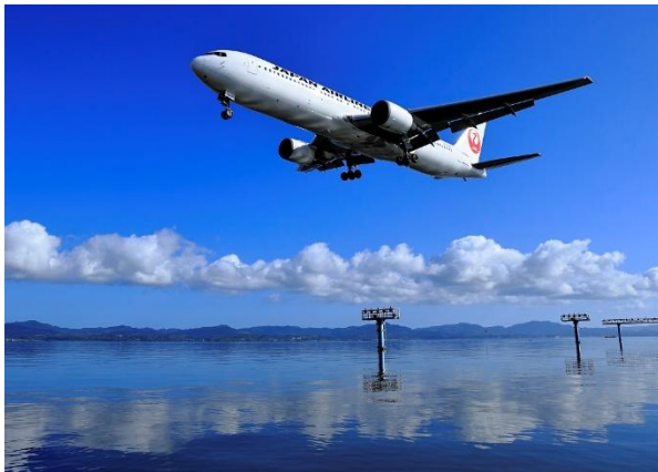
最優秀賞「晩夏の朝、湖畔にて」