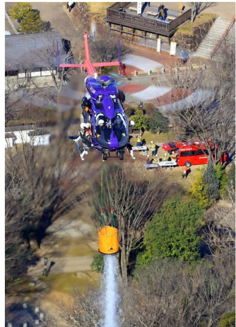
官用機部門グランプリ賞「林野火災消火訓練」