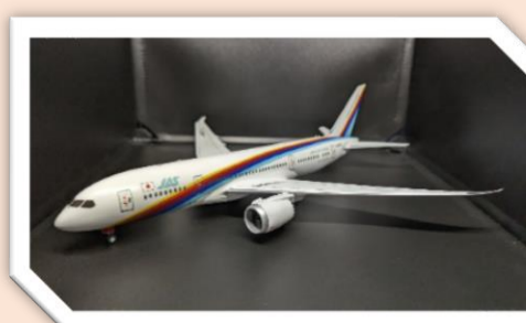
第3回 あいち航空 ミュージアム賞 「JAS B787-8 レインボーエイト」 KF_B789さん

トークショーは入館料のみでご参加いただけます。 天候、その他諸事情により、イベント内容が変更または中止となる場合がございます。